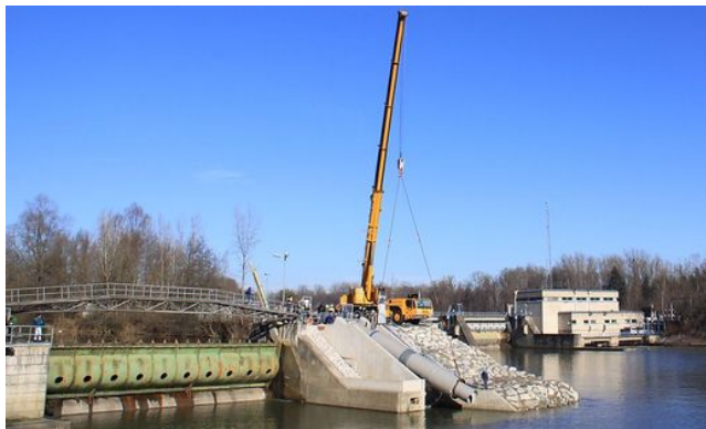
Einbau der Wasserkraftschnecke

Beim Verbund-Kraftwerk in Retznei wurde eine Wasserkraftschnecke montiert. Erstmals wird diese österreichische Entwicklung im Echtbetrieb getestet. Von Wilfried Rombold Zuletzt aktualisiert: 15.01.2015 um 06:30 Uhr